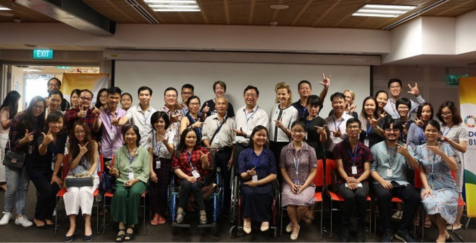
Nhiều chuyên gia, đại diện các tổ chức khởi nghiệp và doanh nghiệp xã hội, người khuyết tật tham gia sự kiện.

tạo và kết nối với chuyên gia, nhà đầu tư, tổ chức hỗ trợ khởi nghiệp trong mạng lưới khởi nghiệp sáng tạo Việt Nam.