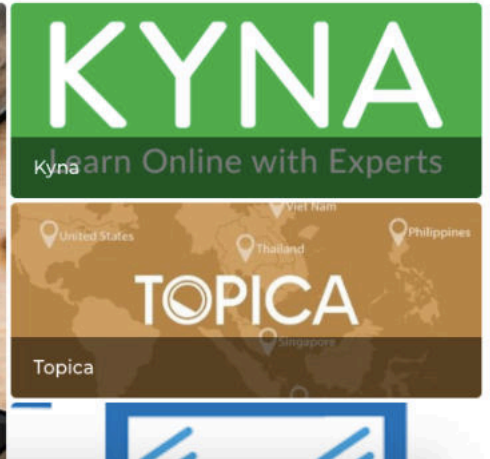
Trang chủ của website vntechpedia.com