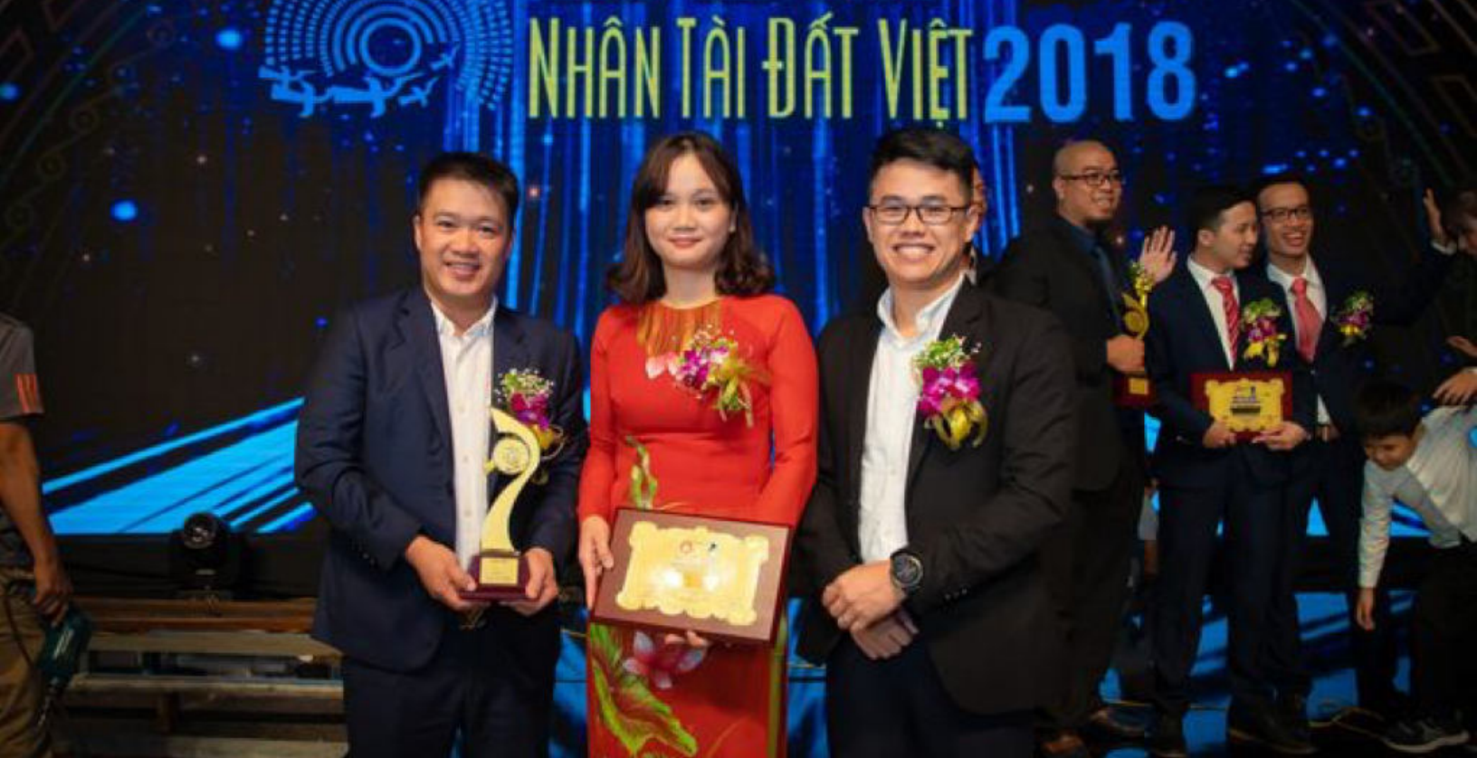
Dự án Vbee đạt giải Nhân tài Đất Việt 2018

là các doanh nghiệp lớn, hơn 12.000 khách hàng sử dụng ứng dụng Vadi và trên 100.000 yêu cầu mỗi ngày trên website công ty (Vbee.vn).