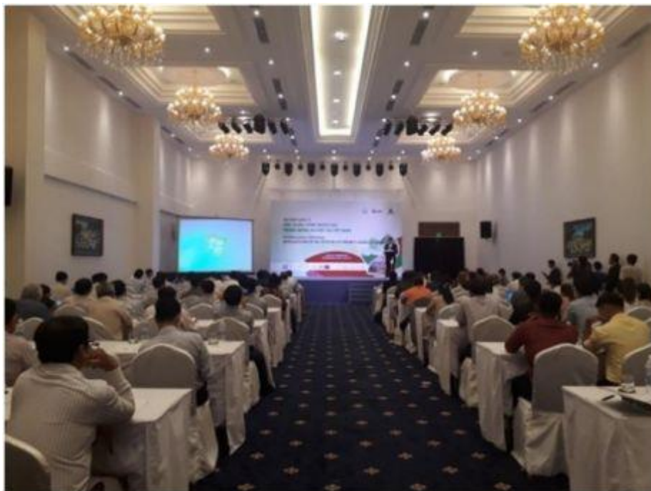
Toàn cảnh Hội thảo.

(NASATI) Viện Ứng dụng Công nghệ (Bộ Khoa học và Công nghệ) phối hợp với Công ty Cherry Media tổ chức Hội thảo Quốc tế “Ứng dụng Công nghệ cao trong Nông nghiệp tại Việt Nam”. Tham dự Hội thảo có Lãnh đạo các ban, ngành Trung Ương, lãnh đạo các tỉnh thành phía nam như Hậu Giang, Bình Thuận, Cà Mau, Lâm Đồng..., lãnh đạo các sở KH&CN các tỉnh Bến Tre, Sóc Trăng, Đắk Lắk, Đắk Nông... và các chuyên gia đến từ các trường đại học, viện nghiên cứu lớn trong và ngoài nước.